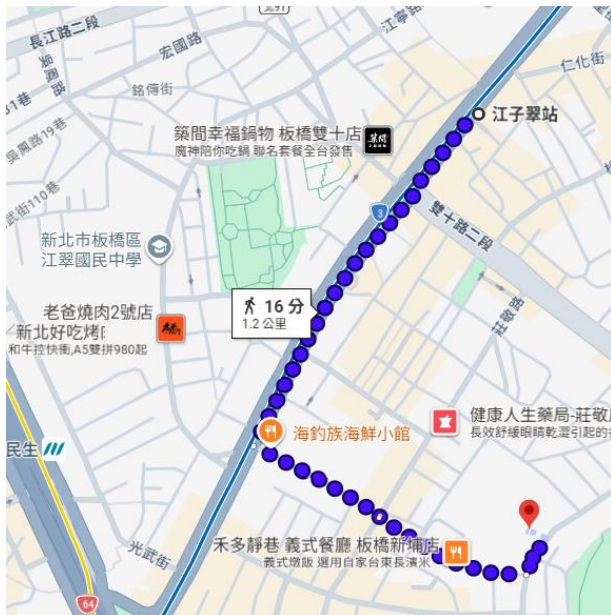
板南線/江子翠站捷運3號出口